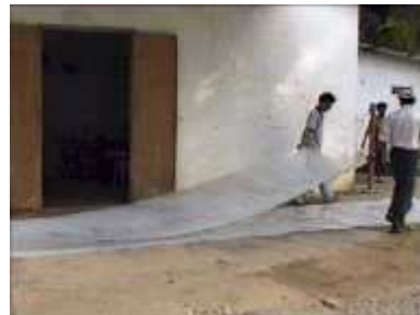
Photo 8. Découpe de la seconde pièce de plastique

Deux longueurs de plastique sont nécessaires car elles seront placées l'une dans l'autre pour assurer une meilleure résistance de la paroi du digesteur.