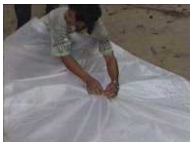
Photo 14. Maintenir le plastique