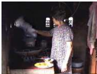
Photo 60. Il faut connecté le réservoir de gaz à l'entrée de gaz du poêle