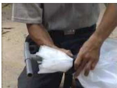
Photo 54. On place un nouveau tube en forme de « T » à l'autre ouverture du futur réservoir : un bout sera connecté au digesteur, l'autre à l'appareil alimenté en biogaz

Photo 53. Une des deux ouvertures du tube en plastique est maintenant fermée