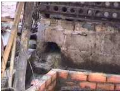
Photo 64. Un conduit est réalisé à l'aide de briques pour diriger les déchets liquides vers l'entrée du digesteur

On peut réaliser un conduit à l'aide de briques et de ciment pour relier l'évacuation des déchets et le tube d'entrée du digesteur.