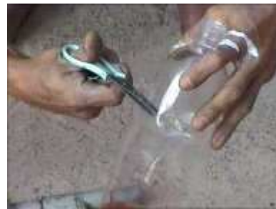
Photo 46. On fait un trou pour ajouter de l'eau