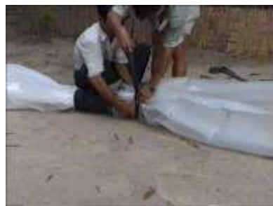
Photo 33. On fixe ce tube de plastique au tube de sortie