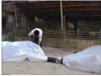
Photo 35. On libère le premier tube en plastique de la ficelle qui l'entoure