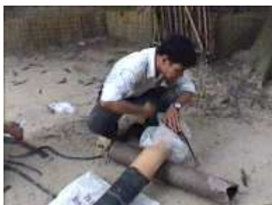
Photo 25. On ferme l'ouverture du tube d'entrée avec un sac plastique

Ensuite, il faut remplir le tube plastique d'air avant de le placer dans la tranchée.