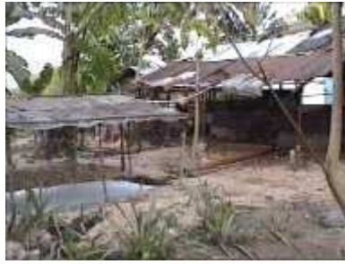
Photo 74. Le système complet : un toit peut protéger le biodigester des rayons UV.