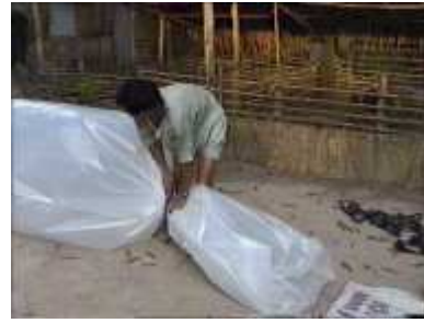
Photo 30. On peut ficeler l'extrémité pour emprisonner l'air tout en laissant de la place pour insérer le tube de sortie

On renferme l'air à l'intérieur du cylindre en plastique. Il ne faut pas oublier de laisser dépasser une longueur de plastique afin d'y insérer le tube de sortie des résidus. On rajoute un élément de plastique d'une longueur de 3 m pour assurer un nouveau remplissage du tube principal.