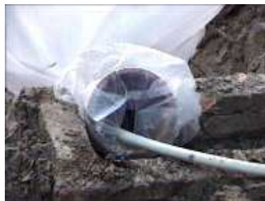
Photo 44. On peut brancher un tuyau d'arrivée d'eau si une pompe est disponible