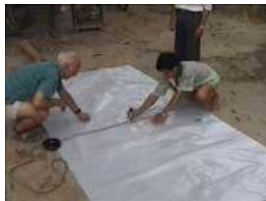
Photo 13. On fait une marque pour découper le plastique