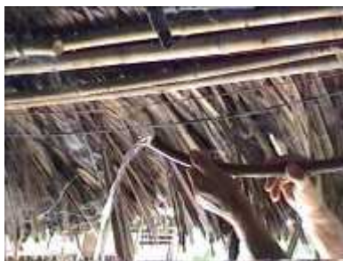
Photo 76. Accumulation d'eau (pb 6-1) : ouvrir le joint pour évacuer l'eau