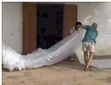
Photo 11. On place les deux pièces de plastique l'une dans l'autre