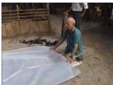
Photo 27. Tenir le plastique