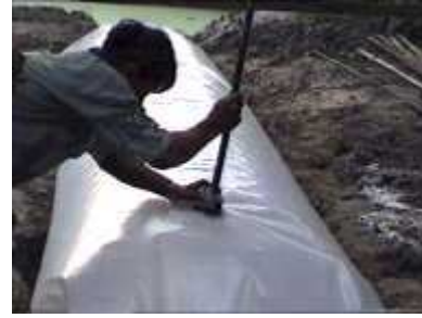
Photo 42. Connexion du tuyau de distribution au tube de sortie du gaz