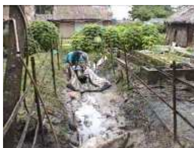
Photo 83. Tirer le plastique hors de la tranchée