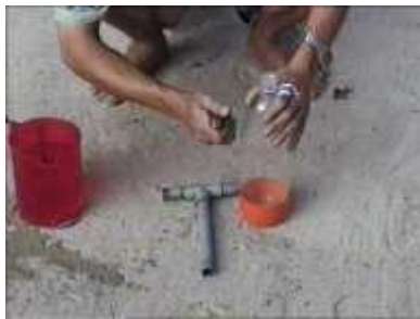
Photo 45. Eléments nécessaires à l'élaboration du piège à eau (PVC en forme de « T », bouteille plastique, couteau et eau)

Il ne reste plus qu'à suspendre le piège à eau de façon à pouvoir le remplir facilement et à le connecter aux tubes d'arrivée et de sortie du biogaz.