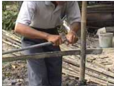
Photo 43. Connexion du tuyau de distribution du gaz au support