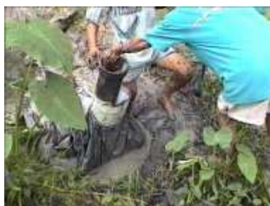
Photo 85. Récupérer les bandes de caoutchouc et les tubes d'entrée et de sortie du fumier