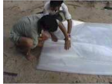
Photo 19. On commence à recouvrir le tube à l'aide du plastique