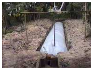
Photo 67. L'installation est terminée