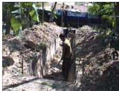
Photo 5. Réalisation d'une tranchée dans le sol

Afin de faciliter l'écoulement du lisier, il est préférable que celui-ci coule par gravité directement de la source vers l'entrée du digesteur.