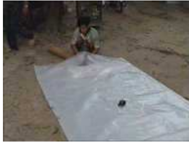
Photo 18. Mise en place du tube à l'entrée

On insère le tube en céramique jusqu'à moitié de sa longueur dans la pièce de plastique. Le joint entre les deux éléments est assuré par une bande de caoutchouc que l'on enroule tout autour.