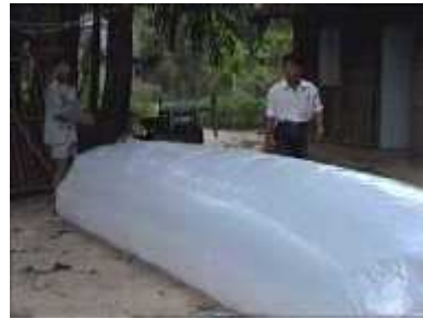
Photo 38. Le digesteur est maintenant rempli d'air