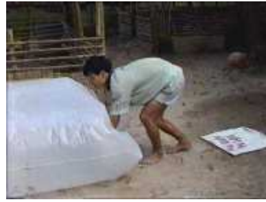
Photo 36. On force l'air à passer du tube de 3m de long au tube principal