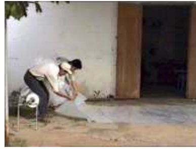
Photo 10. Début de la phase d'enfilement des deux pièces de plastique qui augmentera la résistance du digesteur