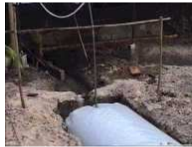
Photo 65. Le conduit est relié au digesteur