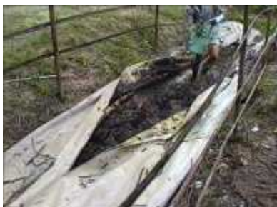
Photo 80. On découpe le plastique pour retirer la matière