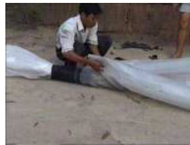
Photo 32. On place un tube de plastique supplémentaire d'une longueur de 3m