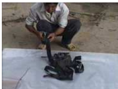
Photo 22. On découpe une bande de caoutchouc