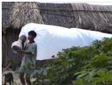
Photo 39. Transport du digesteur

Ensuite, il est nécessaire de remplir d'eau le digesteur jusqu'à ce que les tubes d'entrée et de sortie soient parfaitement recouverts d'eau (à l'intérieur du digesteur). L'air est maintenant piégé à l'intérieur du digesteur et l'on peut retirer les films de plastique à l'entrée et à la sortie du digesteur.