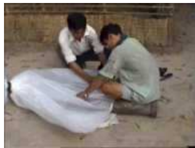
Photo 31. Mise en place du tube de sortie (même procédure que pour le tube d'entrée)

On renferme l'air à l'intérieur du cylindre en plastique. Il ne faut pas oublier de laisser dépasser une longueur de plastique afin d'y insérer le tube de sortie des résidus. On rajoute un élément de plastique d'une longueur de 3 m pour assurer un nouveau remplissage du tube principal.