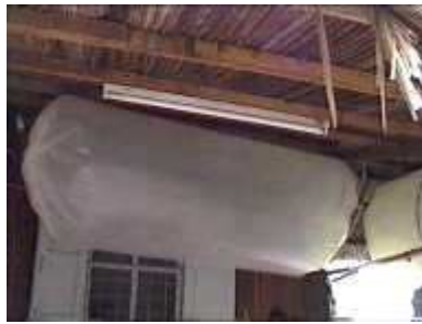
Photo 62. Une corde autour du réservoir est utilisée pour augmenter la pression