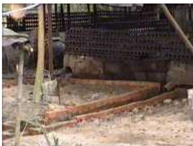
Photo 66. Réseau de distribution des déchets