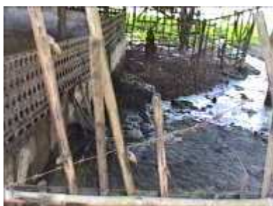
Photo 3. Pollution de l'environnement