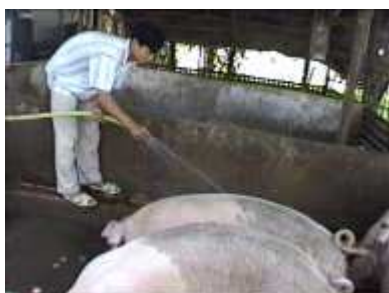
Photo 1. Nettoyage d'une porcherie

Les images suivantes illustrent la pollution de l'environnement par les déjections animales dans une exploitation :