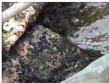
Photo 81. Couche dure de fumier du à l'accumulation de terre et au temps (3 années)