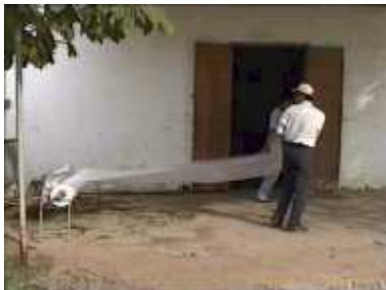
Photo 7. Prélèvement de la bonne longueur de plastique

On déroule la bonne longueur de plastique qui correspondra à la longueur du digesteur. Il est important de prévoir une longueur supplémentaire de 1m de chaque côté pour pouvoir placer les tubes d'entrée et de sortie du digesteur.