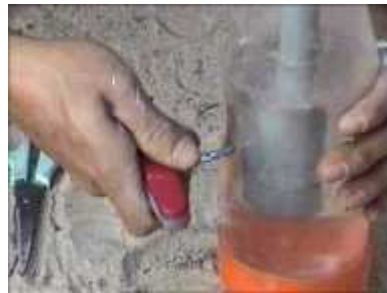
Photo 47. On insère le tube en PVC dans la bouteille, on remplit d'eau et on fait un petit trou pour fixer le niveau d'eau