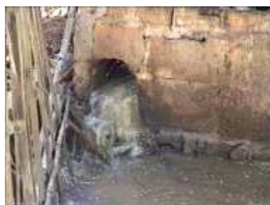
Photo 2. Les déchets liquides s'écoulent à l'extérieur de l'enclos