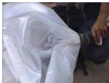
Photo 51. On bouche un des deux bouts du cylindre de plastique qui servira de réservoir (il peut être d'une longueur de 3m)

Photo 52. On fixe correctement cette partie du réservoir avec une bande de caoutchouc