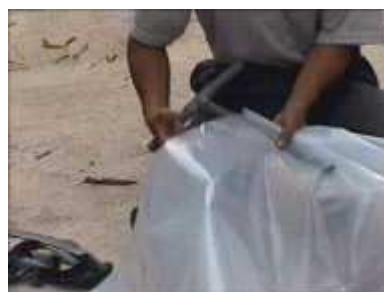
Photo 53. Une des deux ouvertures du tube en plastique est maintenant fermée

Photo 54. On place un nouveau tube en forme de « T » à l'autre ouverture du futur réservoir : un bout sera connecté au digesteur, l'autre à l'appareil alimenté en biogaz