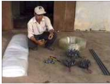
Photo 6. Matériaux nécessaires à la mise en place d'un digesteur en plastique