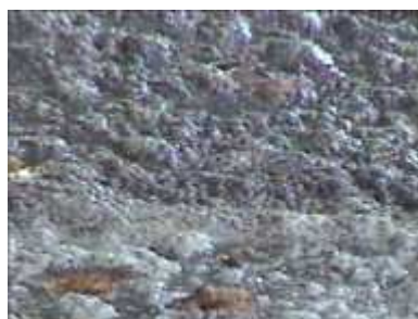
Photo 4. Production de méthane et pollution de l'air

La mise en place d'un digesteur va permettre d'utiliser le lisier afin de produire du biogaz utile mais aussi de diminuer la charge polluante de cette biomasse.