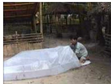
Photo 34. On pompe à nouveau l'air à l'intérieur du tube en plastique