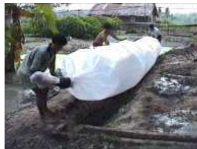
Photo 40. On place le digesteur dans la tranchée