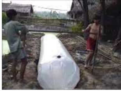
Photo 41. Un support est mis en place pour soutenir le tuyau de distribution du gaz