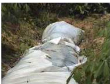
Photo 79. La couche supérieure de plastique est déchirée (au bout de 3 ans)