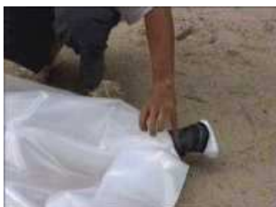
Photo 52. On fixe correctement cette partie du réservoir avec une bande de caoutchouc

Photo 51. On bouche un des deux bouts du cylindre de plastique qui servira de réservoir (il peut être d'une longueur de 3m)