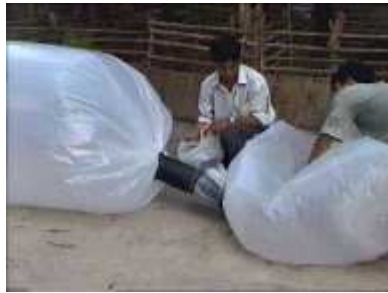
Photo 37. On complète jusqu'à ce que le tube principal soit rempli d'air