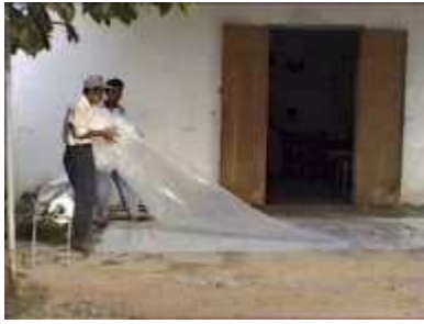
Photo 9. On met en boule une des deux pièces de plastique afin de la mettre à l'intérieur de l'autre