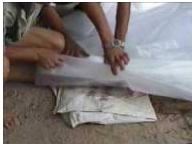
Photo 20. On recouvre de chaque côté