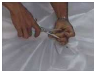
Photo 15. Découper le plastique