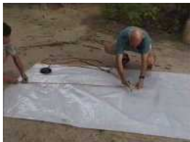
Photo 12. On mesure la bonne distance

La taille du trou dépend du diamètre extérieur de l'adaptateur mâle en PVC.