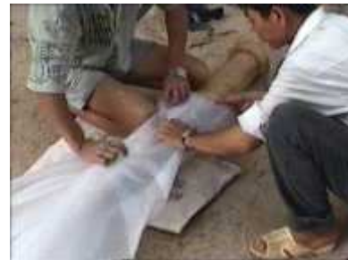
Photo 21. Nous sommes prêt à fixer les éléments ensemble