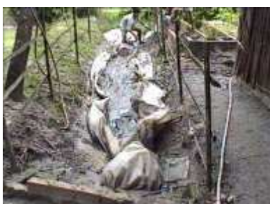
Photo 82. Après avoir retiré toute la matière