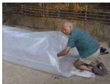
Photo 28. On pompe l'air pour remplir le digesteur