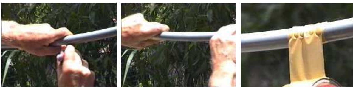
Photo 77. Faire un trou dans le conduit en PVC, laisser couler l'eau, reboucher avec une bande de scotch (pb 6-2)