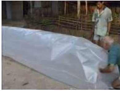
Photo 29. Le digesteur est rempli d'air