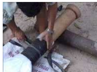
Photo 23. On enroule le caoutchouc autour du plastique pour le fixer au tube